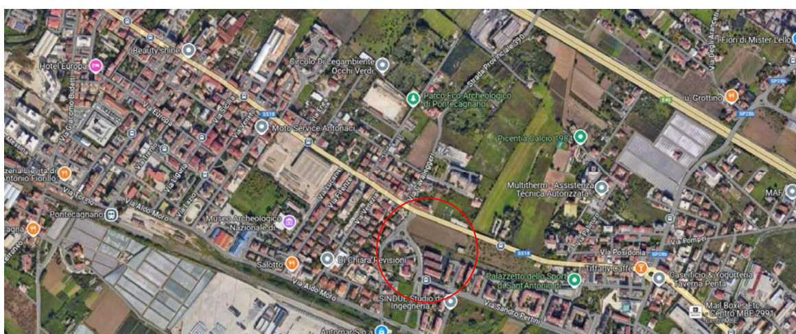
Area ubicazione intervento

Le aree adibite alla costruzione del nuovo edificio, nonché l'area occupata dai fabbricati esistenti e dalla viabilità esistente, sono situate a NORD della linea F.S. Salerno-Battipaglia ed a SUD della S.S.18 Tirrena Inferiore alla loc. S. Antonio di Pontecagnano Faiano; sono in disponibilità del Comune di Pontecagnano Faiano e ricadono rispettivamente in superfici riportate in Catasto Terreni al Foglio 7 p.lla 1455 (1890 mq) e porzione di p.lla 2213 (3300 mq), al Foglio 7 p.lla 2737 (6281 mq), nonché al Foglio 7 p.lle 1960 (820 mq), 1964 (160 mq), 1967 (320 mq) (cfr. Tav. 2 – inquadramento).